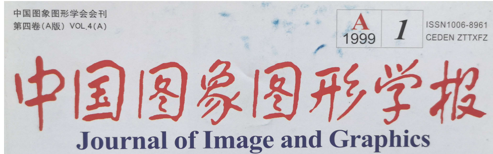
图 1：“中国图象图形学报”封面标注“(A 版)”

从表 2 可见，创办初期相对来说变动多一些，盖因在不断摸索中。事实上，初期在封面设计、栏目设计、版式等多方面还有许多小的改动。其中在 1999 年到 2003 年期间，在学报名下还发行了另一个刊物（简称“学报（B 刊）”，见另文“21 期的学报 B 刊”），所以这段时间学报封面都标有“中国图象图形学报（A 版）”，例如图 1。